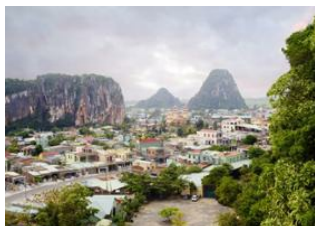
Hue 📍 🚗 90km - ⌚ 2h Danang 📍