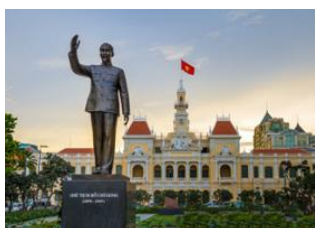
Hoi An 📍