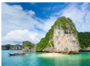
Tam Coc 📍 🚗 180km - ⌚ 4h Cat Ba 📍