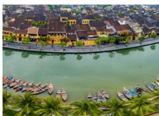
Cat Ba 📍 🚗 200km - ⌚ 3h Hanoi 📍 ✈️ 650km - ⌚ 1h 30m Danang 📍 🚗 30km - ⌚ 50m Hoi An 📍