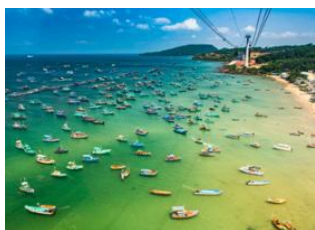
Phu Quoc 📍