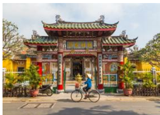
Hoi An 📍