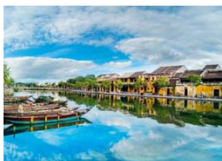
Hoi An 📍