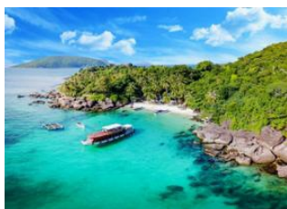
Phu Quoc 📍 ✈ 320km - ⌚ 1h Saigon 📍